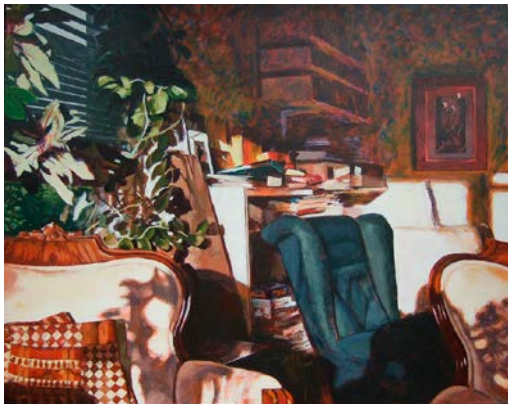
"Interiör", akryl på mdf, 60x80 cm

Jag har en fascination inför det obegripliga och "hemliga" som ständigt omger oss i vardagen.