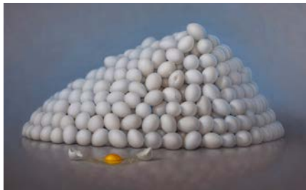
"Ägg", mixed media, 78x119 cm

Fascinerande måleri med utpräglad Trompe-l'oeilleffekt. Han tillhör de numera ganska få som med pensel och färg kan skapa tredimensionella rum, som man upplever som verkliga. Arbetar både med olja och grafik. Ställer f.n. även ut i London.