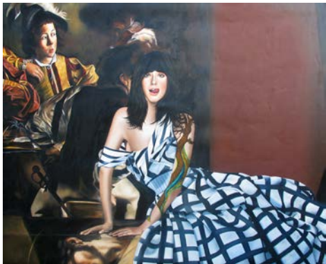
"Dolus", olja på duk, 145x180 cm

Avslutande nyligen sin debututställning på Galleri Final. En utställning om mötet mellan en dåtida konstnärlig innovatör och nutida känslgestaltning. Deltar på Fabriken för första gången.