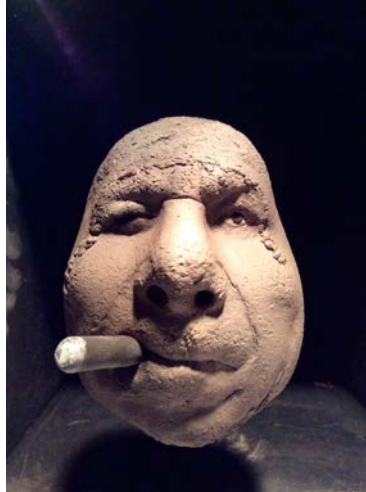
"Nylle", rakubränd keramik, höjd ca 12 cm

Ett av Österlens mest välkända ansikten, och hans "Nyllen" har setts världen över. Alla unika, med sitt alldeles speciella uttryck. En anonym massa kan vara första intrycket av ett överväldigande myller av människor, men vid närmare skärskådande en insikt att varje 'nylle' är unikt och varje individ värd sin egen uppmärksamhet.