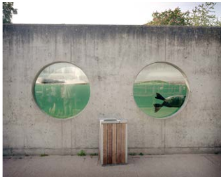
"Zoo World", digital print

Hon visar den berörande och uppmärksammade bildsviten "Zoo World". Deltar på Fabriken för första gången.