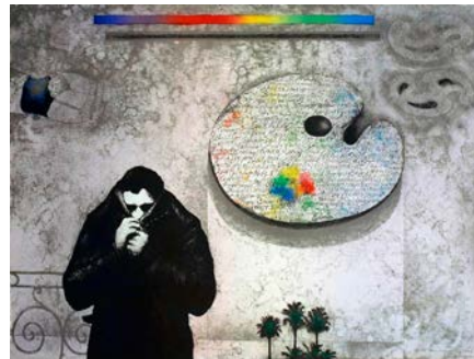
"Autoportrait Mee", litografi, 60x80cm

Många såg hans utställning på Galleri Final för ett par år sedan. Nu är han tillbaka med nya målningar och han kan snart sammanfatta ett händelserikt 75-årigt konstnärsliv.