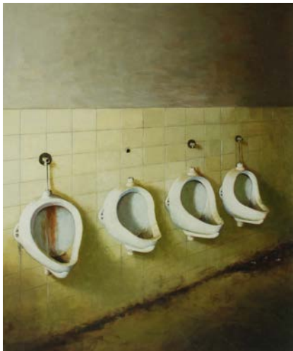
"Pissoar", 87x72 cm, akryl på masonit

Jag tror jag försöker skildra frusna ögonblick av närvaro i känslan av att allt är dömt att försvinna. Som barn trodde jag att alla ting hade liv. Den känslan har inte helt lämnat mig. Deltar på Fabriken för första gången och ställer även fn ut på Galleri Final i Malmö.