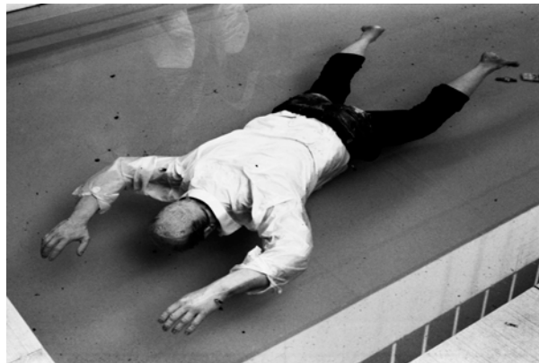
"Fragments", digital print på bomullspapper

"Fragments" är en serie dagboksanteckningar i bilder, ytterst privata och förmedlar ett tillstånd som kan vara svårt att sätta ord på.