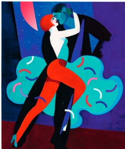
"Nära", litografi, 55x42 cm

Född 1920 och en av våra mest folkära konstnärer. Behärskar måleriet och tecknandet till nästan fulländning och gör det med en outsinlig kreativitet. Utöver originalmålningar visar vi även ett litet antal Giclée-tryck av Åkes illustrationer i såväl färg som svartvitt.