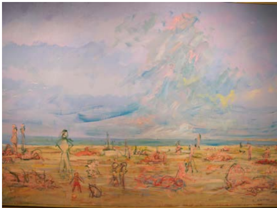
"Solbadare på Näset", akryl på duk, 80x120 cm