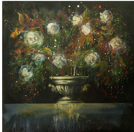
"Cracked flowers white", olja på duk, 75x75 cm