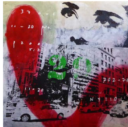
"Audrey looking up", mixed media, 100x100 cm

Ung och orädd konstnär som blandar graffitti och klassiska tekniker med motiv som man aldrig tröttnar på. Först arbetar fotografen inom honom, han tar alla bilder själv, därefter tar målaren och screentryckaren Karl Valve över. Kan numeras på utställningar runt om Europa.