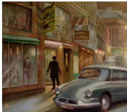
"Hatrick", olja på duk, 53x60