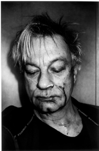
"Självporträtt", analogt fotografi, silvergelatiner

En av Sveriges främsta fotografer med en internationell arena. Även aktuell på Moderna museet i Malmö. Slog igenom med serien Café Lehmitz från Hamburg på 70-talet. Det jag sysslar med kan beskrivas i ett ord egentligen och det är närvaro. Nyligen avslutat en stor utställning på Bibliotheque de France i Paris och som kommer att visas på Fotografiska i Stockholm i höst. Även aktuell med en utställning på Moderna Muséet i Malmö.