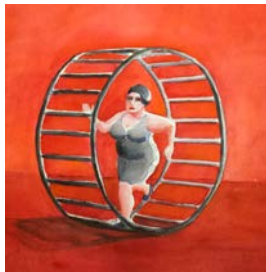
"The rat race", 30x30 cm, akvarell och resin

Underbara målningar som illustrerar människans ständiga kamp med sig själv och omgivningen.