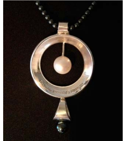
Halsmycke, silver, pärla och onyx