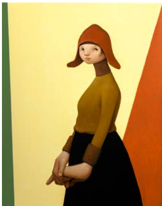
"Flicka med röd mössa", olja på duk, 90x70 cm

En av Sveriges mest intressanta figurativa målare. Deltar på Fabriken för första gången.