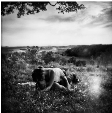
"Kyssten", Lowlands, 40x40 cm, silvergelatin

Har under de senaste åren nått internationella framgångar. Aktuell med utställning på Moderna Muséet i Malmö.