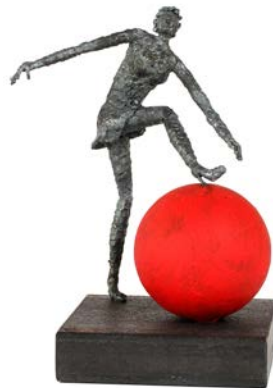
"Övertramp", järn, höjd ca 12 cm

Bor bland äppelträden på Österlen och skapar uttrycksfulla järnsculpturer där både humor och hantverksskicklighet samsas.