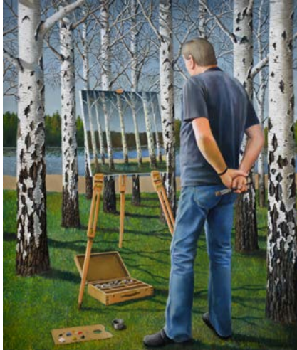
"The Artist", olja på duk, 100x90 cm

Hans välkända målningar med både surrealistiska och realistiska uttryck, har nått internationella framgångar med utställningar och deltagande på konstmässor i Europa och New York. Hans produktion är liten och exklusiv, ca 10-15 målningar per år.