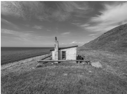
"Kåseberga", digital print, 11x15 cm

Visar för första gången en underbar svit bilder från Österlen. Även aktuell med bilder på Moderna Muséet i Malmö. Deltar på Fabriken för första gången.