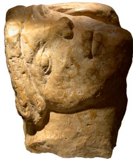
"Tell", fransk kalksten, höjd ca 50 cm