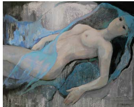
"Pell de dona", olja på duk 73x92

Målar ömsinta och poetiska kvinnoporträtt och betagande Mallorca landskap. Född och bosatt på Mallorca.