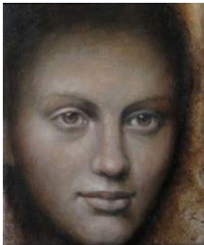
"Pige paa guldbund", pastell på trä, 30x25cm

Tidlösa ikonmålningar med inspiration från renessansens och barockens mästare. Bosatt i Köpenhamn.